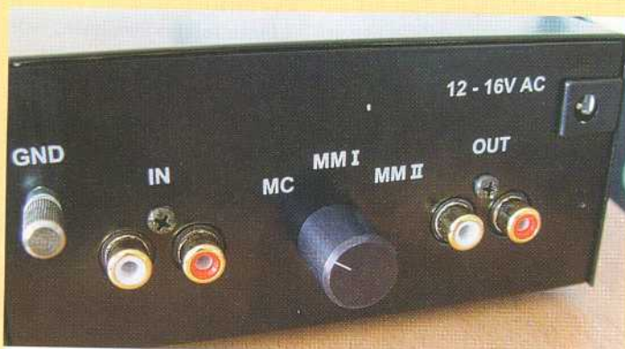
Baksidan rymmer förgyllda in- och utgångar, jordskruv och en omkopplare för lägre eller högre MM-förstärkning och MC.

Jämförelseobjekt blev den drygt fyra gånger så dyra S.A.T. Phonofix, designad för att avge så bra balanserad signal som möjligt. Men vi började obalanserat och lyssningen förbryllade helt klart. Vi bytte fram och tillbaka ett antal gånger men kunde faktiskt inte bestämma oss för vad som lät bäst. Nästa dag fortsatte vi att lyssna på Vincent utan jämförelser och intrycken var desamma: Vincent låter helt enkelt mycket bra. Den är tydlig i allt den gör från bas till diskant och ljudbilden är relativt stor och exakt. Detaljprecisionen är mycket bra. Basen är fast och uppåt