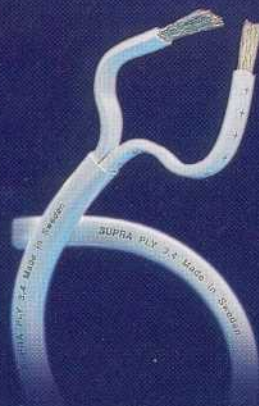
Supra Ply 3.4 Rek. cirkpris inkl. moms 70,-/m