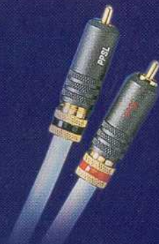
Supra EFF-ISL Rek. cirkpris inkl. moms 750,-/par