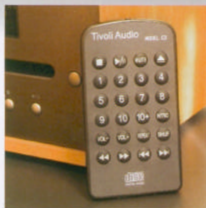
Til CD-spilleren følger det med en fjernkontroll, med volumkontroll.

Den kan fint kobles til et hvilket som helst anlegg med linjeinngang. CD-spilleren spiller CD-R, koster 2390 kroner, kompletterer Tivoli Model Two og lager et ekte stereoanlegg av det hele. Den samlede prisen kommer da opp i 5380 kroner. Midt i et marked som domineres av sjelløse plastikkanlegg med faket aluminium og vinyltrukne høyttalere. Mikro og mini-markedet. Det som er verre, er at få av småanleggene vi har testet er noe særlig til musikkanlegg. Dessverre. For til prisen tilbyr de alt