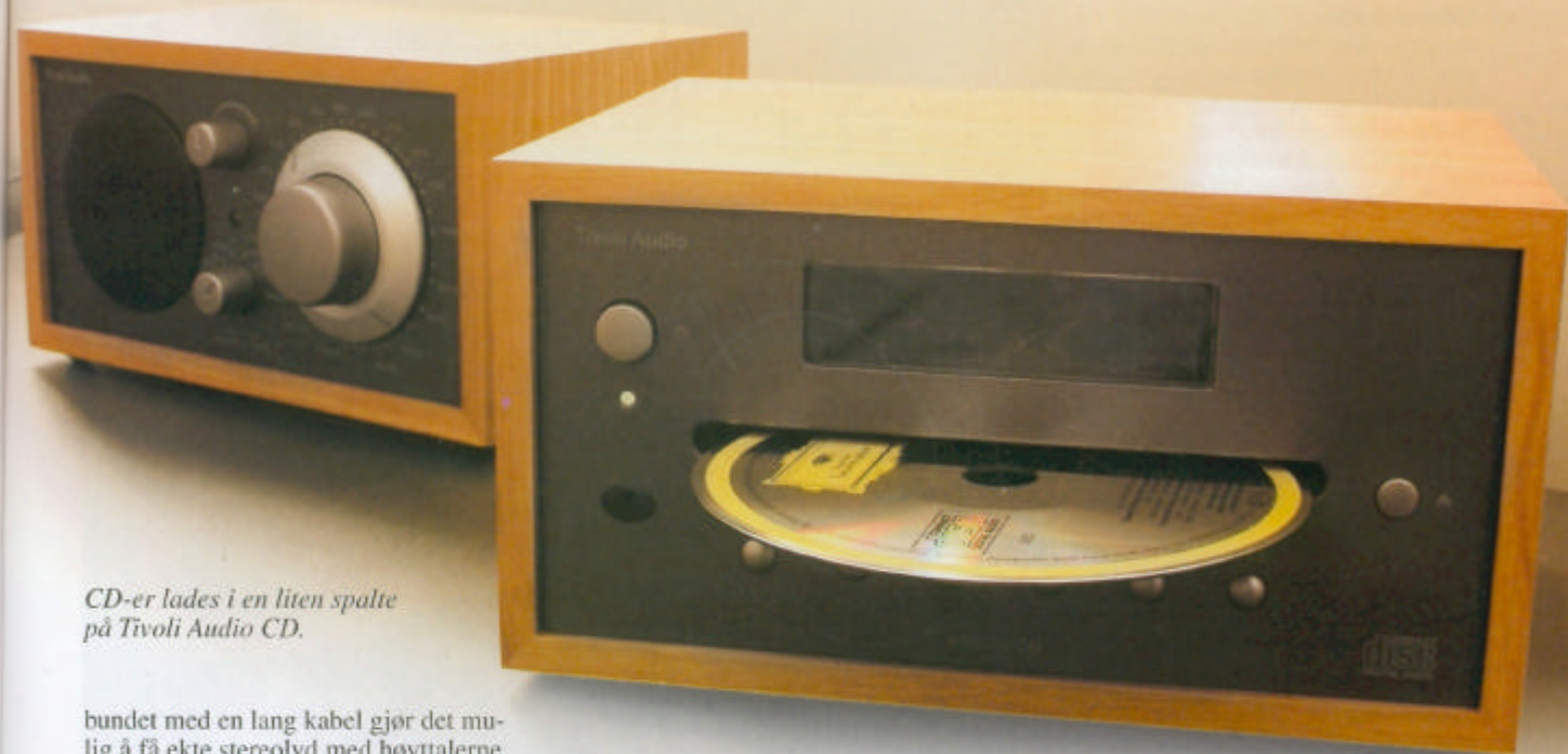
CD-er lades i en liten spalte på Tivoli Audio CD.

bundet med en lang kabel gjør det mulig å få ekte stereo lyd med høyttalerne mye lengre fra hverandre enn du får i en vanlig stereo bordradio. På forsiden ser den akkurat ut som monoradioen, bare fargen er forskjellig.